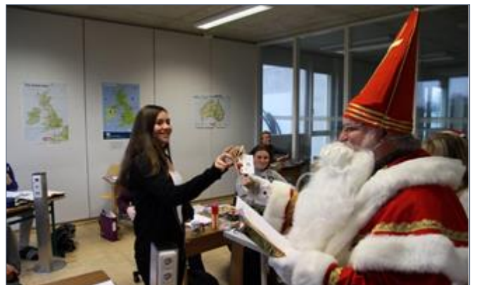
Die Fairtrade AG